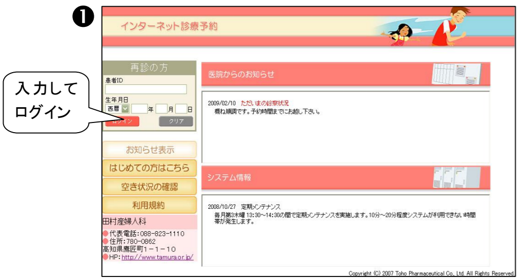
① 予約用のID番号と生年月日を入力し、ログインします。