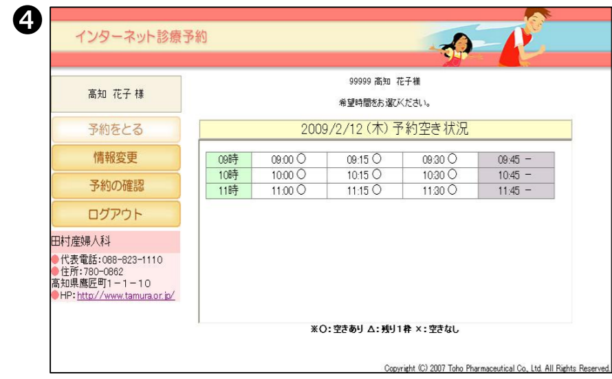
④ 予約をしたい時間を選択します。