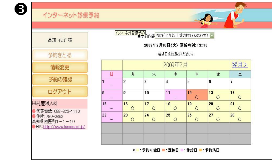
③ 予約をしたい日にちを選択します。