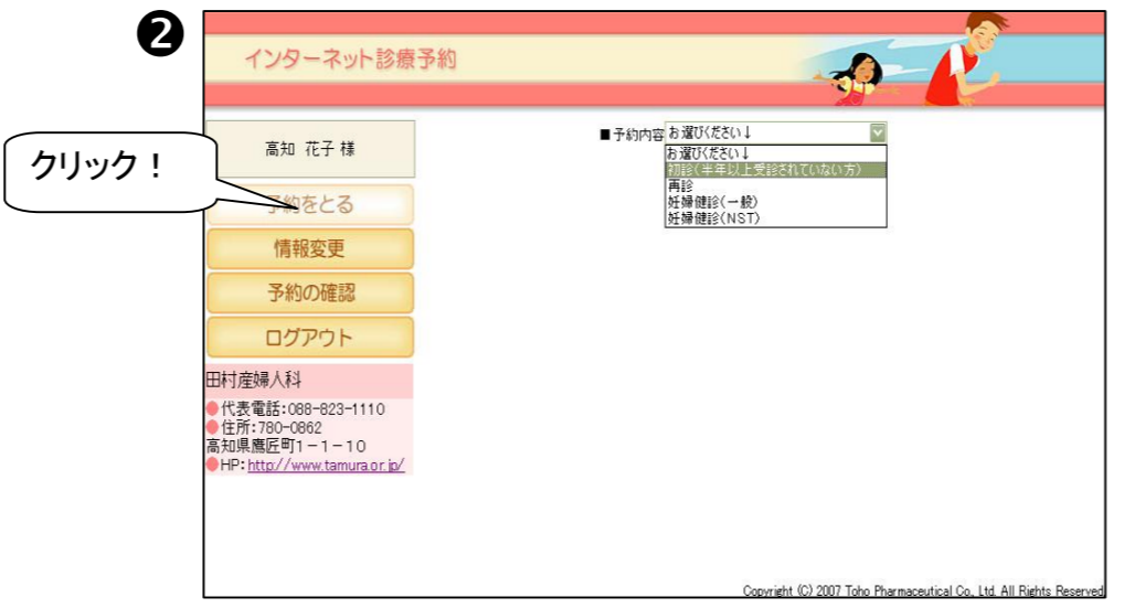
② 【予約をとる】をクリックし、予約したい科目を選択します。